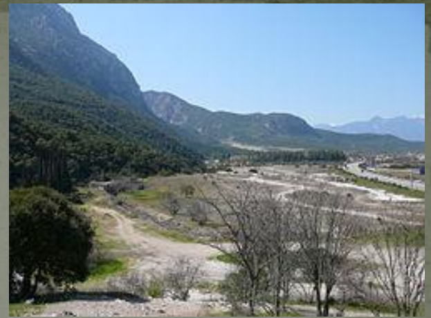
Το πεδίο της μάχης σήμερα

• Η Μάχη των Θερμοπυλών διεξήχθη το 480 π.Χ. μεταξύ των Ελλήνων και των Περσών, κατά την δεύτερη περσική εισβολή στην Ελλάδα. Οι Πέρσες είχαν ηττηθεί στον Μαραθώνα δέκα χρόνια νωρίτερα, γι' αυτό και ετοίμασαν μια δεύτερη εκστρατεία, αρχηγός της οποίας ήταν ο Ξέρξης. Ο Αθηναίος πολιτικός και στρατηγός Θεμιστοκλής έπεισε τους Έλληνες να κλείσουν τα στενά των Θερμοπυλών και του Αρτεμισίου. Οι Πέρσες, οι οποίοι κατά τις αρχαίες πηγές είχαν εκατομμύρια άνδρες στρατό και κατά τις σύγχρονες εκατόν με τριακόσιες χιλιάδες άνδρες, έφθασαν στα στενά στις αρχές του Σεπτεμβρίου.