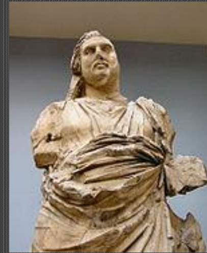
Άγαλμα που λέγεται ότι απεικονίζει τον Μαύσωλο