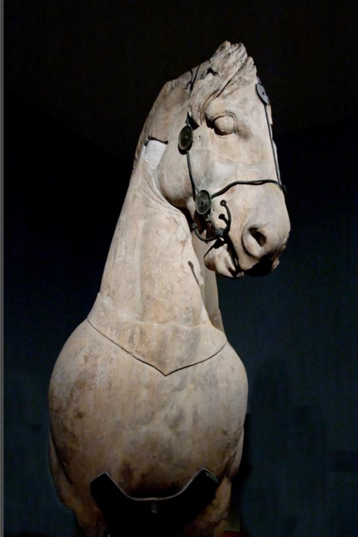
Ένας μαρμάρινος ίππος με υπολείμματα από μπρούντζινο χαλινάρι