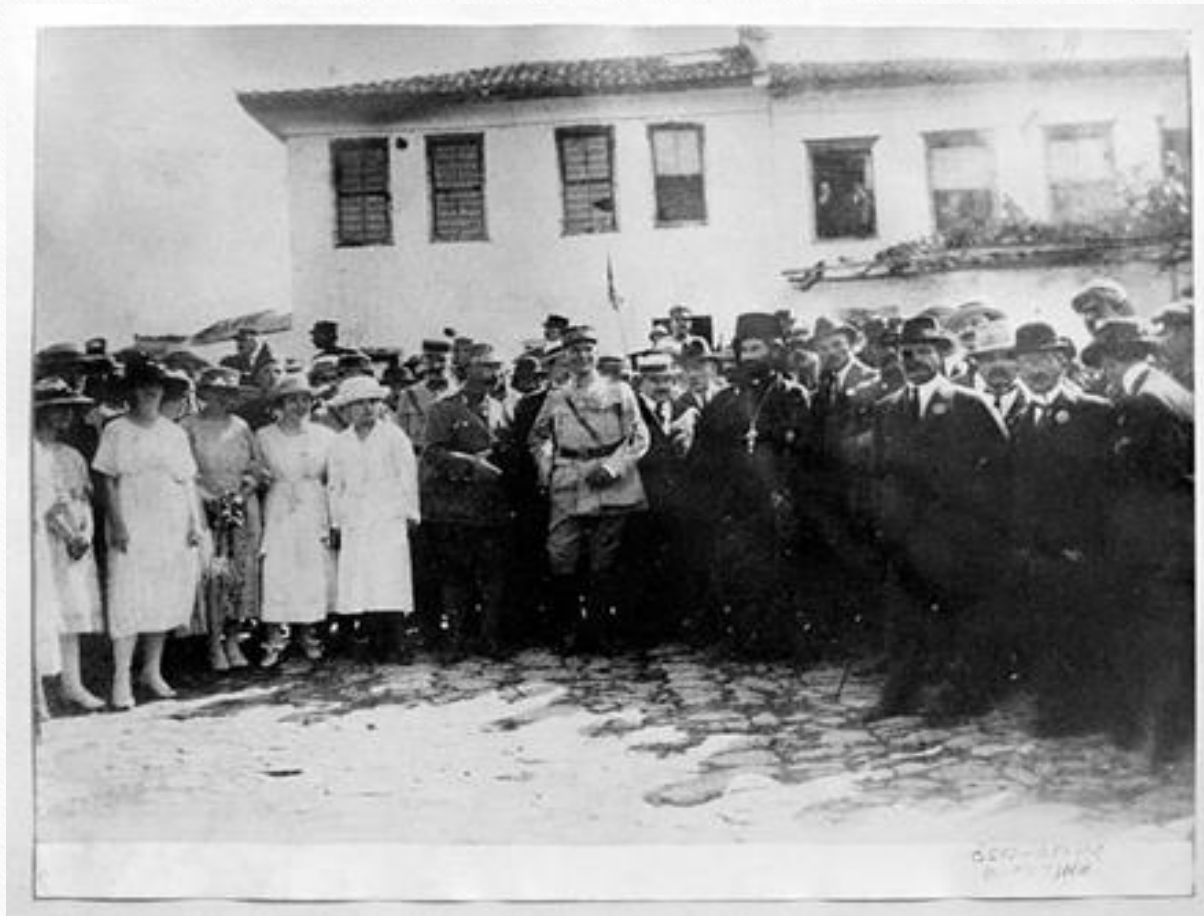
14 Μαΐου 1920. Ιστορική εικόνα απελευθέρωσης της Κομοτηνής από τη βουλγαρική κατοχή. Στο κέντρο, ο Γάλλος στρατηγός Σαρπό, δεξιά του ο Έλληνας στρατηγός Ζυμβρακιάκης και αριστερά του ο διπλωμάτης Χαρίσιος Βαμβακάς