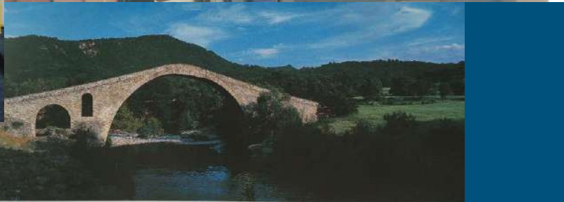
Περικρινός σιλόγος ένα κομμάτι κρηματόν, το οποίο χτυπάει με τον δυνατό άνεμο ώστε να επισημαίνει την προσέγγιση των ταξιδιωτών. The bridge there hang a bell, which rang in strong winds, so as to alert if the travellers and draw their attention.