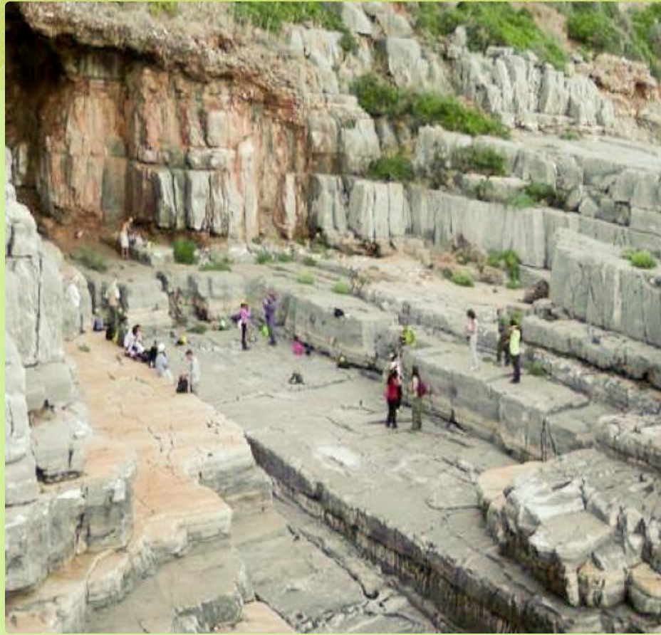
Το "Άγιο Όρος" της Αιτωλίας

❖ Η Βαράσοβα θεωρείται το «ΆΓΙΟ ΌΡΟΣ» της Αιτωλίας λόγω των πολλών ασκηταριών , εκκλησιών (μετόχια άλλων μονών) που δημιουργήθηκαν στις πλαγιές της.