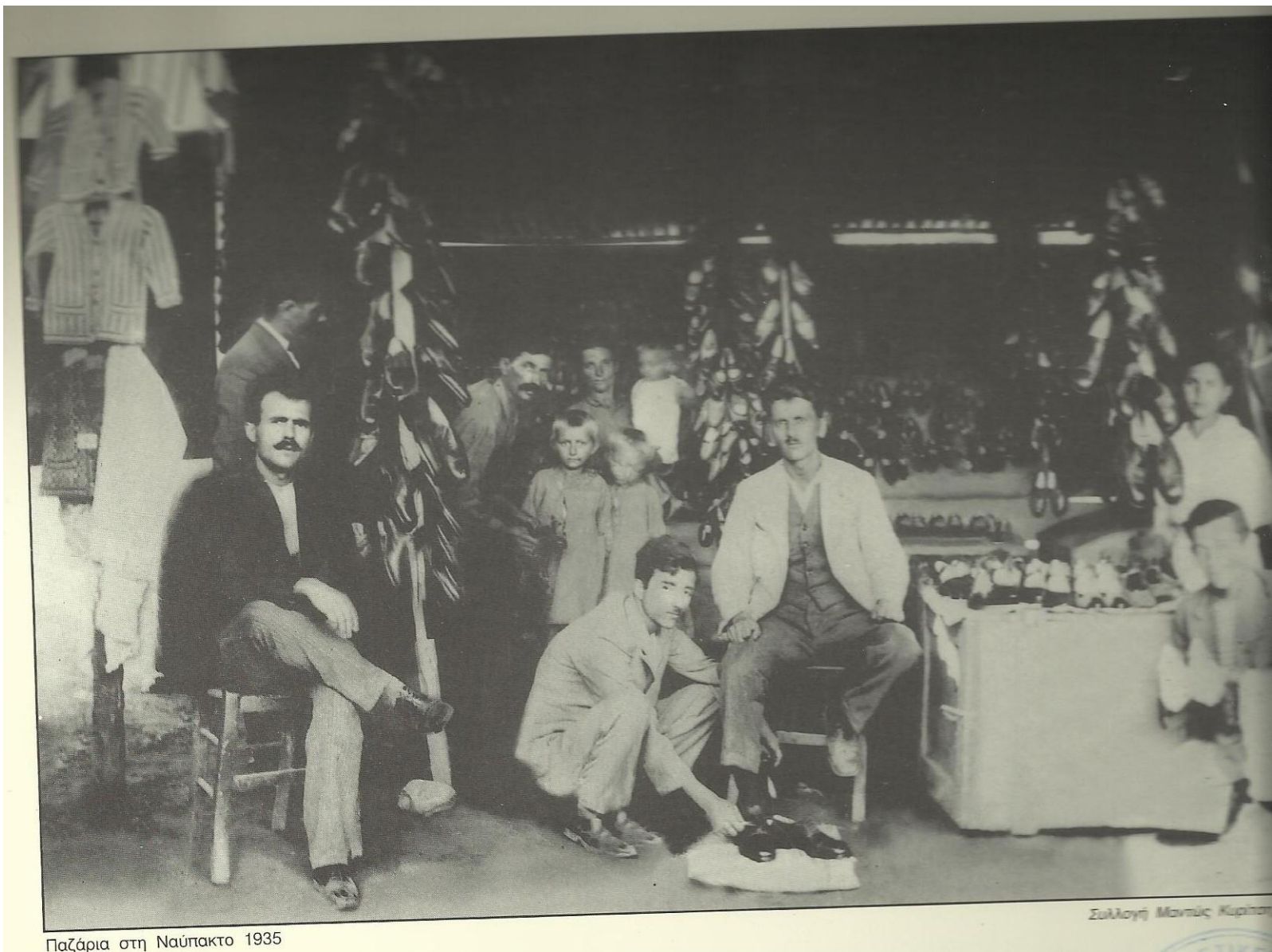
Παζάρια στη Ναύπακτο 1935