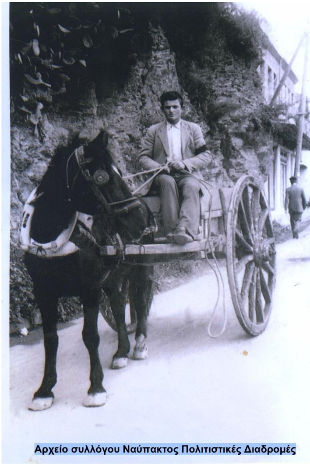
Αρχείο συλλόγου Ναύπακτος Πολιτιστικές Διαδρομές